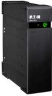
Eaton Ellipse ECO 650 FR